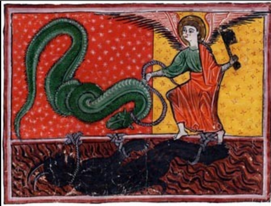
Manuscrito de Las Huelgas (1220), Iluminura do Comentário ao Apocalipse do Beatus de Liebana