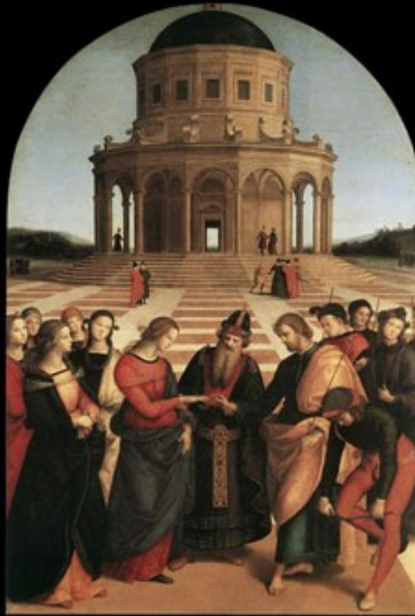
Rafael Sanzio, O casamento da Virgem (1504)