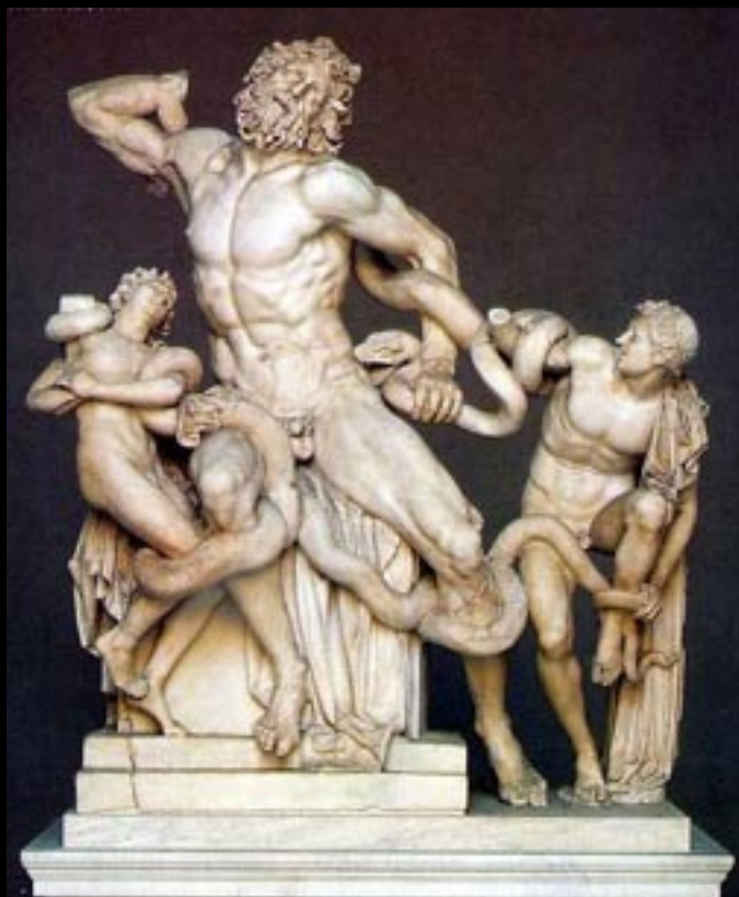
Grécia, Laocoonte (c.25 a.C.)

Esta escultura ilustra a lenda do sacerdote troiano Laocoonte e dos seus filhos, que, por ordem de Atena, foram estrangulados por duas serpentes vindas do mar.