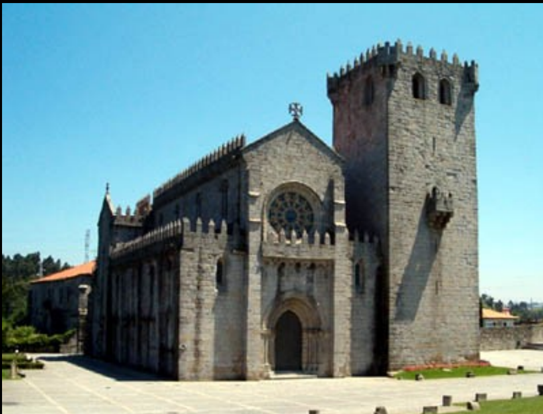
Mosteiro de Leça do Bailio, Porto (Portugal)