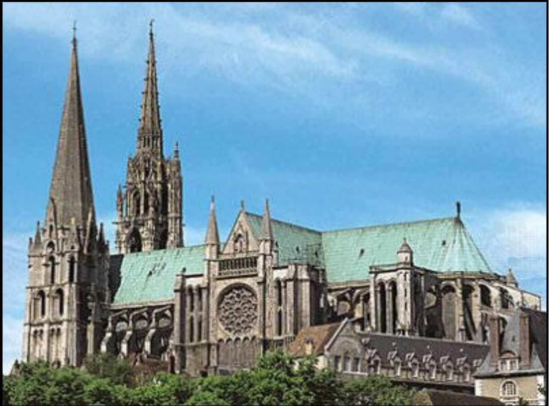
Catedral de Chartres

A partir do século XIII , começa a desenvolver-se um estética da luz , que terá no gótico a sua expressão artística.