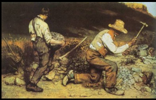
Gustave Courbet, Os Britadores de Pedra (1849-50)

Coubert tinha uma visão sombria deste tipo de trabalhos, afirmando que rebaixavam o ser humano. O quadro foi destruído durante a II a . Guerra Mundial.