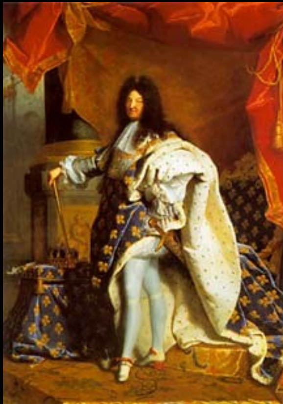
Hyacinth Rigaud, Luís XIV (1701)

Paralelamente começam a adquirir crescente importância ideias estéticas que afirmam a subjectividade do belo . A questão é reduzida a um problema de gosto (sensitivo, não normativo).