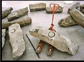
Joseph Beuys, Das ende des 20, Jahrhunderts (1982-83)