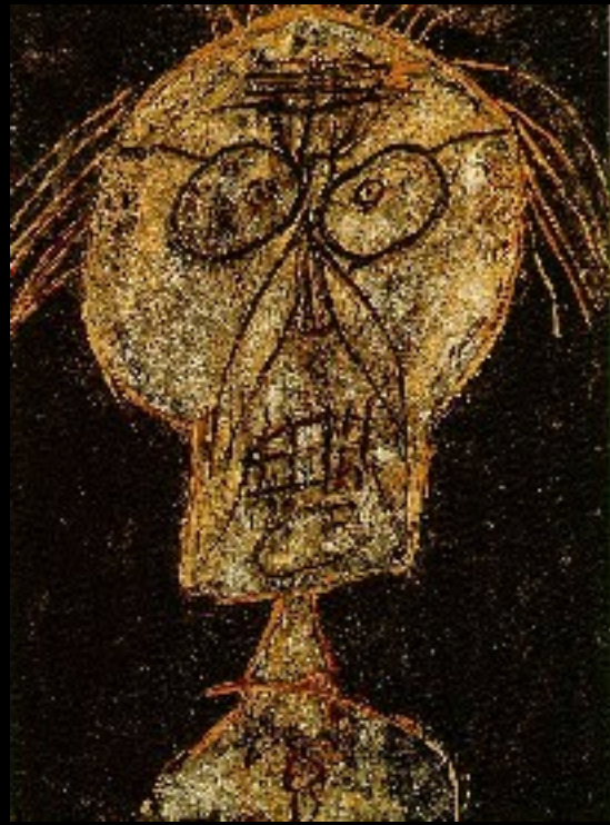
Jean Dubuffet, Dhotel nuance d'abricot (1947)