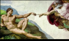
Miguel Ângelo, Criação de Adão, pormenor do fresco na Capela de Sistina (1508- 1512)