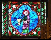
Vitrail da Catedral de Leon, Agnus Dei